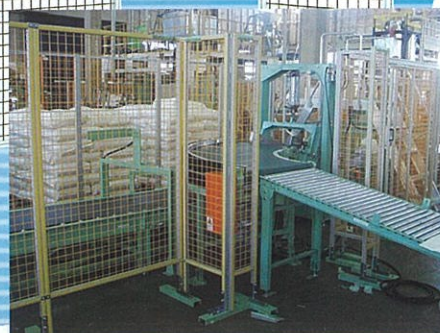
フレックスガードフェンス 使用例