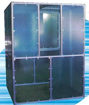
半導体製造装置カ