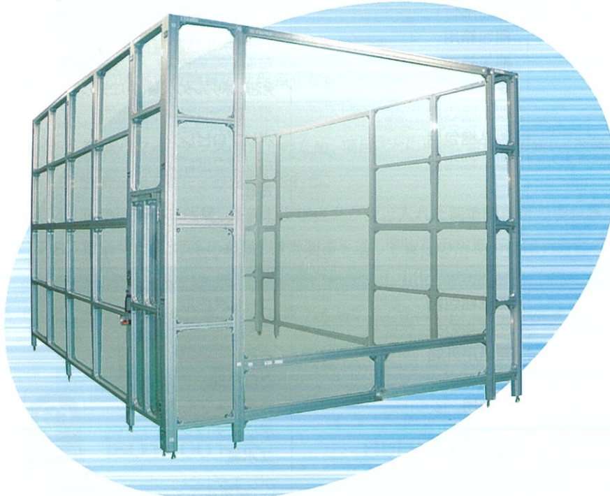
液晶製造装置G6対応クリーンブース