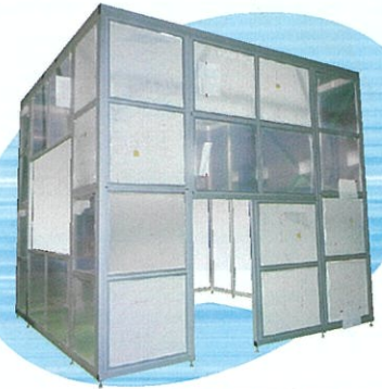
液晶製造装置G8.5 クリーンブース