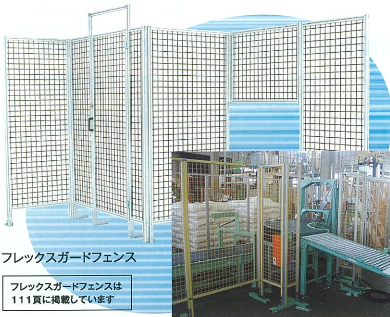
フレックスガードフェンス